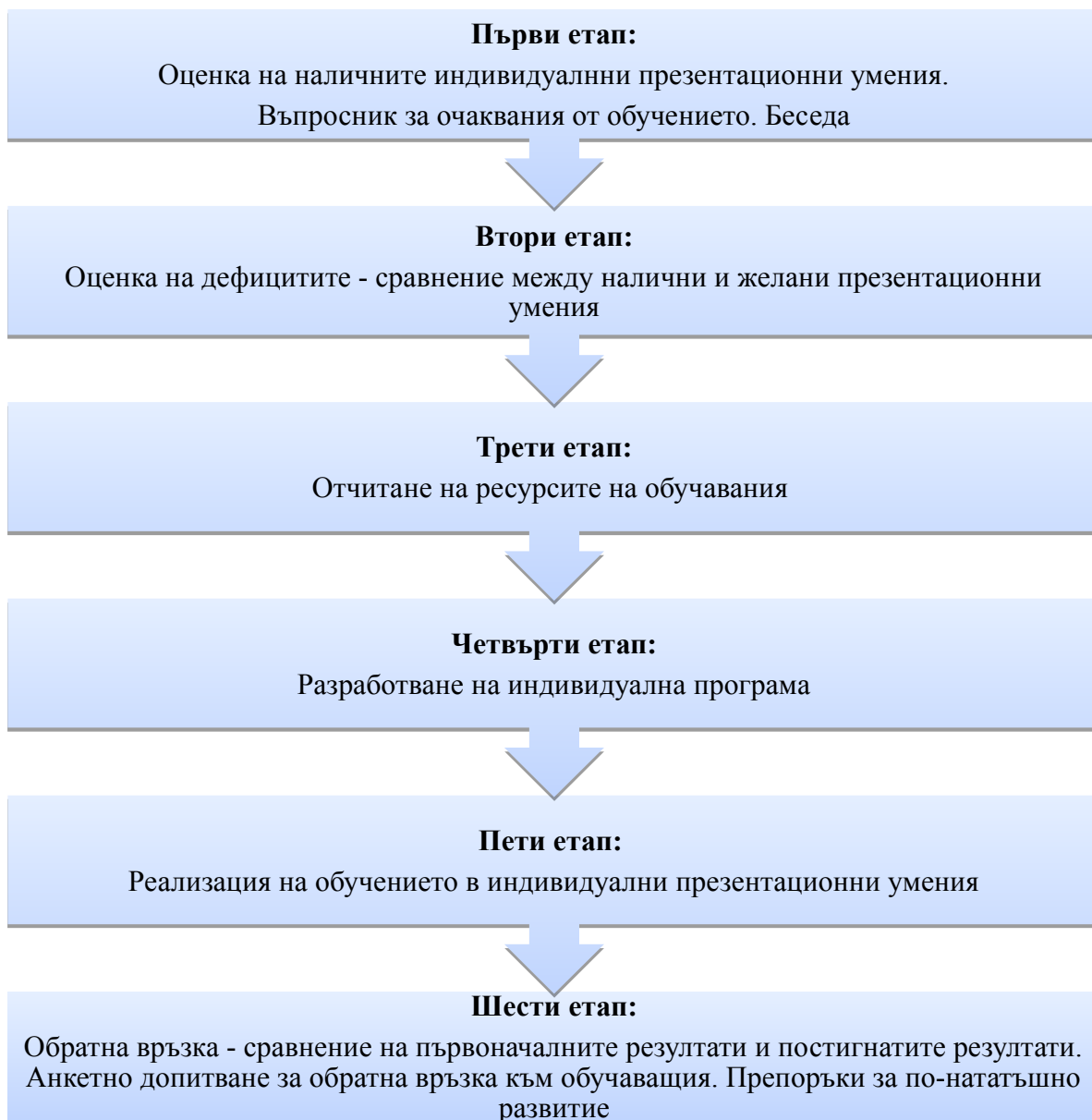
Фиг. 2. Методика за усъвършенстване на индивидуални презентационни умения