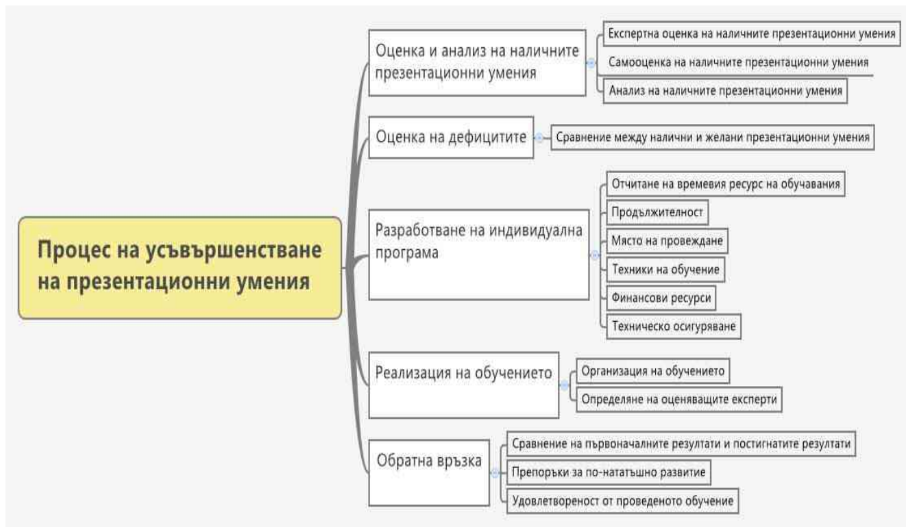
Фиг. 1. Процес на усъвършенстване на презентационните умения